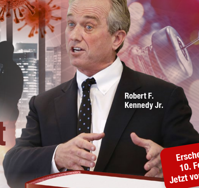
Robert F. Kennedy Jr.

Das wahre Gesicht des Dr. Fauci zeigt im Detail, wie Fauci, Gates und Konsorten ihre Kontrolle über Medien, wissenschaftliche Fachzeitschriften, wichtige staatliche und regierungsnahe Einrichtungen, globale Geheimdienste sowie einflussreiche Wissenschaftler und Ärzte nutzen, um die Öffentlichkeit mit furchterregender Propaganda über die Virulenz und Pathogenese von Covid-19 zu überschwemmen, Kritiker zum Schweigen zu bringen, Debatten zu unterbinden und abweichende Meinungen rücksichtslos zu zensieren.